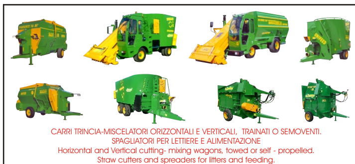
CARRI TRINCIA-MISCELATORI ORIZZONTALI E VERTICALI, TRAINATI O SEMOVENTI. SPAGLIATORI PER LETTIERE E ALIMENTAZIONE Horizontal and Vertical cutting- mixing wagons, towed or self - propelled. Straw cutters and spreaders for litters and feeding.

Http://: www.nasi-srl.com - e-mail: nasi@nasi-srl.com